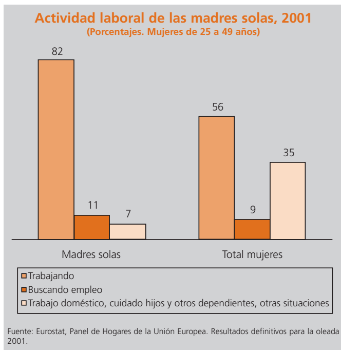
Gráfico del trimestre

Los resultados de la última oleada (correspondiente al año 2001) del Panel de Hogares de la Unión Europea, recientemente difundidos, arrojaron una cifra de en torno a 182.000 hogares monoparentales en España, un 3 por 100 de todos los hogares con hijos menores dependientes. Esta proporción es una de las más bajas de la UE-15, donde en conjunto se alcanzaba un 9 por 100 y en la que las posiciones de los países variaban desde el citado 3 por 100 español hasta el 22 por 100 sueco.